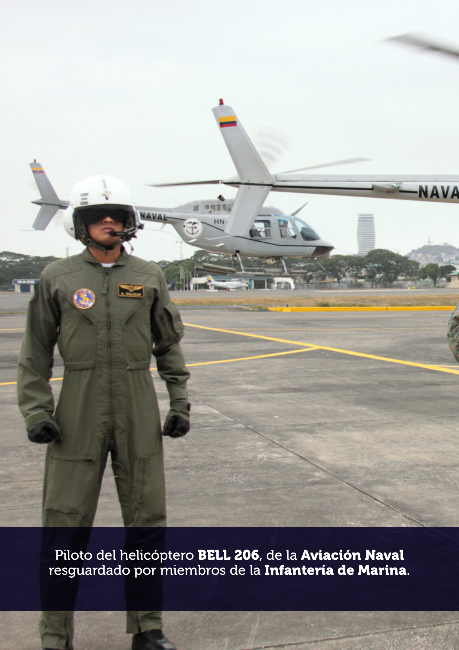
Piloto del helicóptero BELL 206 , de la Aviación Naval resguardado por miembros de la Infantería de Marina .